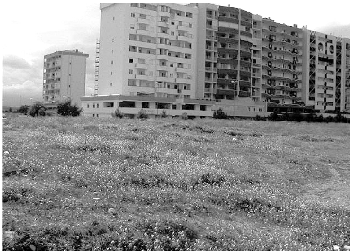
Pochi suoli edificatori a disposizione delle coop: secondo indiscrezioni almeno 35 su 70 rimarrebbero senza terreno. Alcuni richiedenti si stanno già muovendo in anticipo per chiedere che il Comune corra ai ripari e cerchi nuove aree: la «fame» di abitazioni è enorme

A proposito, nei giorni scorsi presso la sede del Consorzio delle cooperative in via Milano si è riunito un Comitato spontaneo composto da quelle cooperative edilizie che hanno preso parte al bando pubblico di concorso per la suddetta assegnazione. Le cooperative promotrici dell'iniziativa sono Il Giardino, Modulo 2000, La Vela, Eraclio, Bompresso, Young, Casabella 2000, Casa Nuova. «Un gruppo di coordinamento - spiegano in un documento - atto a proporre soluzioni per il reperimento di aree al fine di poter realizzare abitazioni economiche e popolari anche a coloro che sono risultate in una posizione graduale non idonea a poter conseguire l'assegnazione del suolo per la costruzione degli alloggi».