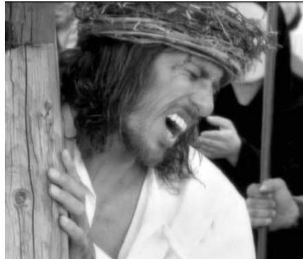
Un momento della rappresentazione a «Cocuzzo»

La stessa associazione «Shalom», va ricordato, già nel Natale scorso ha realizzato, sempre a Cocuzzo, un grande prepe con pupi a grandezza naturale, ca-