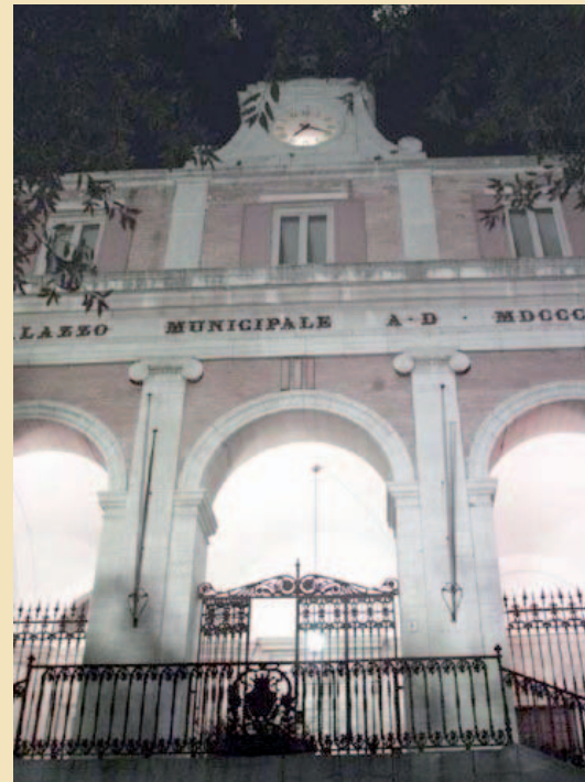
Andria, Palazzo di Città

● ANDRIA. «Il mio profondo convincimento è che quella seduta di consiglio comunale abbia segnato una manifestazione di degrado della vita amministrativa»: la durissima presa di posizione è del sindaco, Vincenzo Zaccaro. Al centro dell'intervento quel che è accaduto nella seduta di consiglio comunale del 31 gennaio scorso. All'ordine del giorno una delibera riguardante un piano di lottizzazione (su via Trani, quindici ettari) venne votata favorevolmente dalla maggioranza di centrosinistra, pur con molte assenze, per il fatto che alcuni consiglieri di centrodestra (Forza Italia e Udc) erano rimasti in aula, mentre gli altri uscivano per far cadere il numero legale, dando la possibilità, di fatto, alla maggioranza di proseguire i lavori e quindi votare la delibera. votazione, poi, e siamo all'avvilente, che è stata annullata in quanto ci si è resi conto che al momento della votazione in aula non c'erano consiglieri comunali che assicurassero il numero legale.