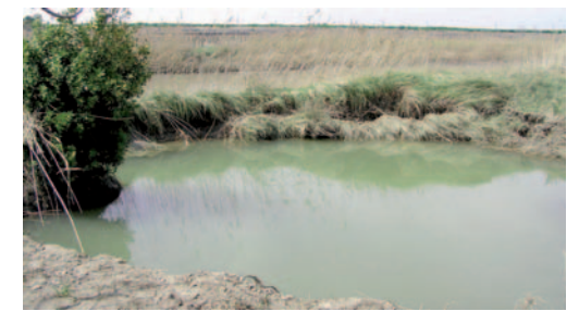
Il fiume Ofanto