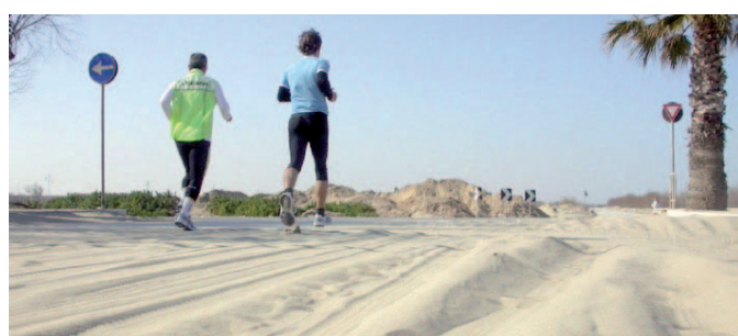
Una significativa immagine della carreggiata sommersa dalla sabbia