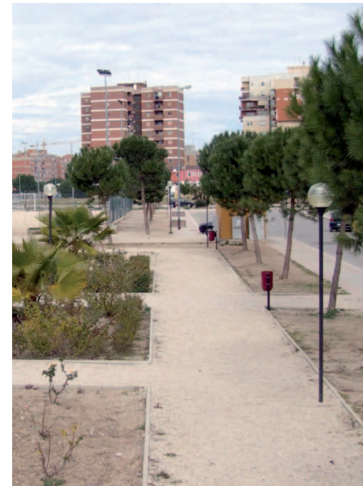
Barletta, la zona 167