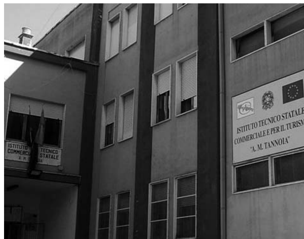
L'istituto tecnico commerciale Tannoia di Corato