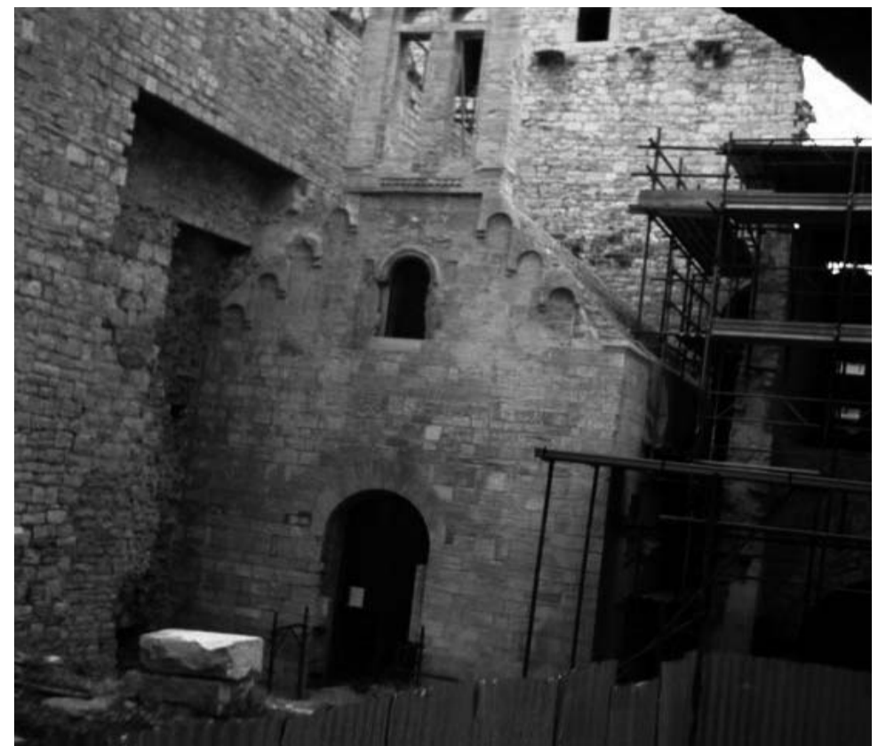
L'antica chiesa di San Giovanni nel castello

È accaduto in via Arco Sant'Antonio. Intervento dei vigili