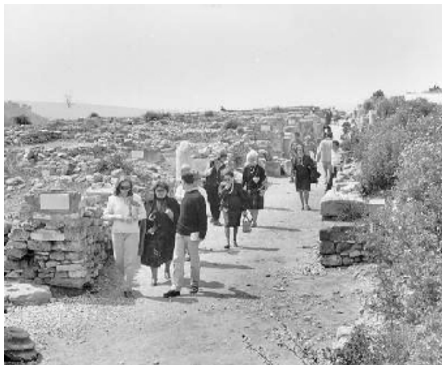
La cittadella archeologica di Canne della Battaglia rappresenta una delle attrazioni turistiche del Nord Barese

BARLETTA - Se il tempo non farà le «bizzze» anche per il ponte del 1° maggio Canne della Battaglia sarà assalita da turisti e visitatori. La cittadella archeologica che, dalla sommità di una collina, domina la valle del fiume Ofanto, sarà visitabile.