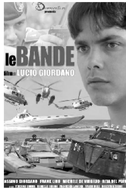
La locandina del film «Le Bande»