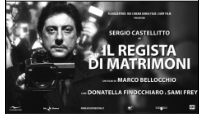
MULTICINEMA GALLERIA PAOLILLO (Barletta) - SEVEN (Gioia Del Colle)

“Bellocchio ha girato un film degno dei capolavori di Bunel.” L'Unità