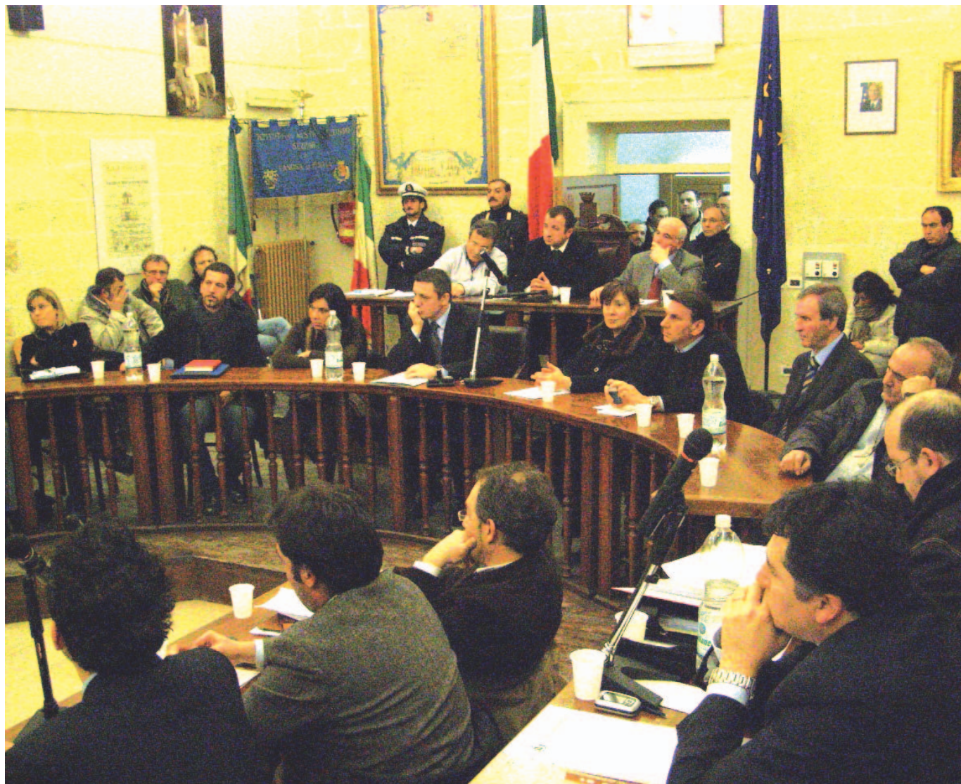
Canosa, la seduta straordinaria del consiglio comunale celebrata ieri sera