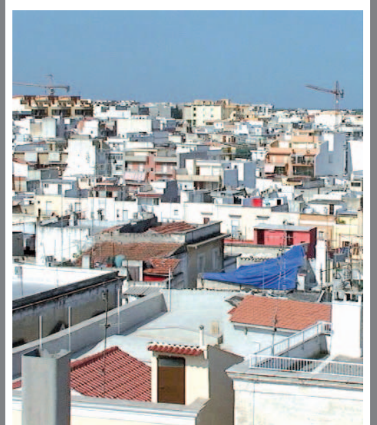
Una panoramica di Andria

● ANDRIA. L'associazione Riformisti del Partito Democratico, il Sunia e la Cgil di Andria hanno contestato quanto è stato deciso dalla Regione Puglia in sede di approvazione del bilancio di previsione 2008: vale a dire la cancellazione della Commissione Casa di Andria.