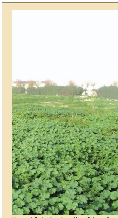
L'area della lottizzazione