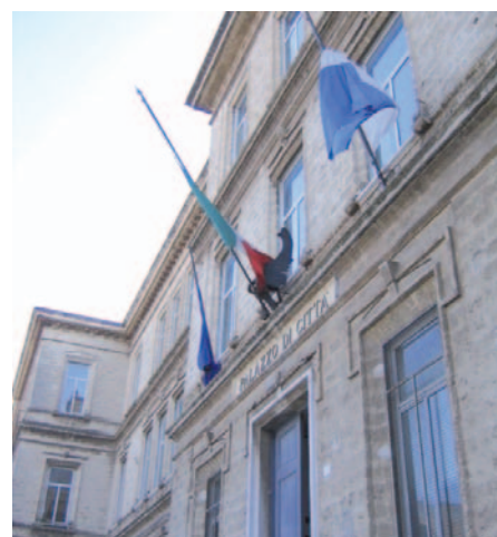
Trani, Palazzo di Città