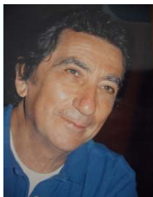
(In Foto Romolo Chiancone)