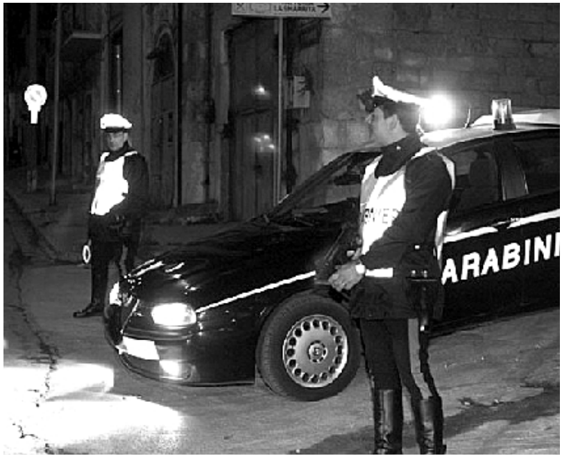
Una pattuglia dei carabinieri

La «gazzella» dei carabinieri, secondo quanto è stato accertato dagli uomini della Polstrada di Ruvo, giunti sul posto per effettuare i rilievi del caso, si stava immettendo su via Balilla quando è sopraggiunta la Seat «Ibiza» il cui conducente, pare, avrebbe ommesso di dare precedenza. Non si