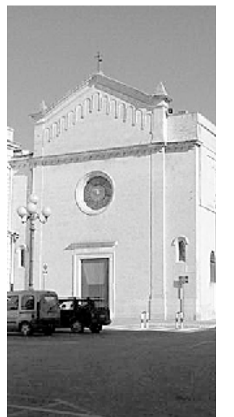
La chiesa dell'Annunziata