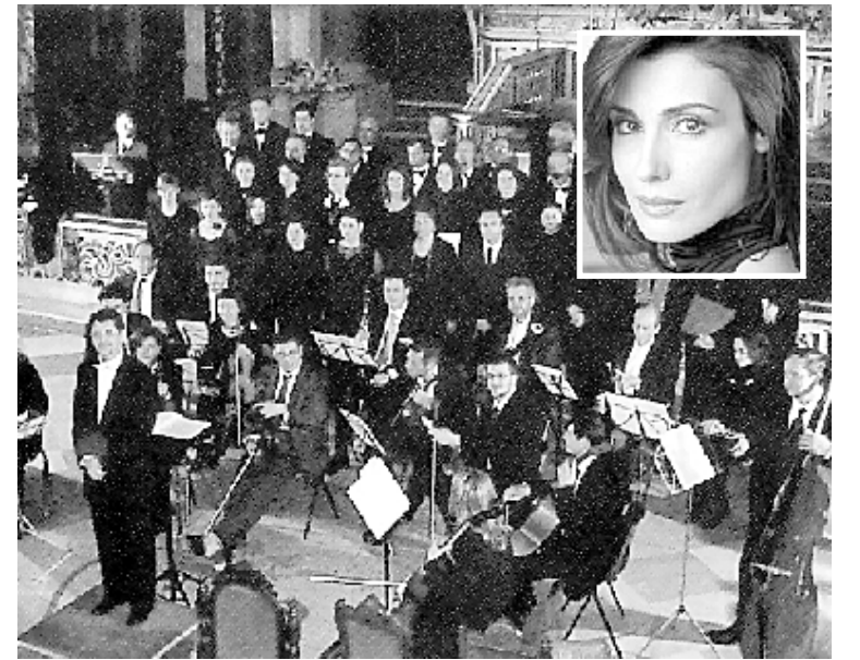
L'Orchestra «Mediterranea» e, in alto, Claudia Koll

«Ho incontrato il Signore in un momento drammatico della mia vita - ha dichiarato di recente l'attrice romana - quando nessuno avrebbe potuto aiutarmi se non Lui che ha risposto al mio grido. Da quel mo-