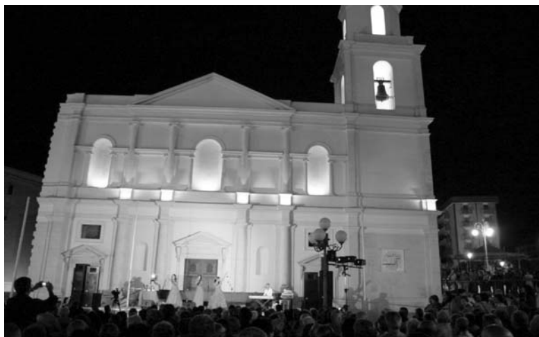
Nelle foto sopra, in apertura, un momento della manifestazione sul sagrato della cattedrale di San Sabino

Una sfilata di nomi importanti e di uomini talentuosi, che stringevano il loro premio fra le mani, mentre l'orchestra continuava a suonare. Tra gli applausi del pubblico.