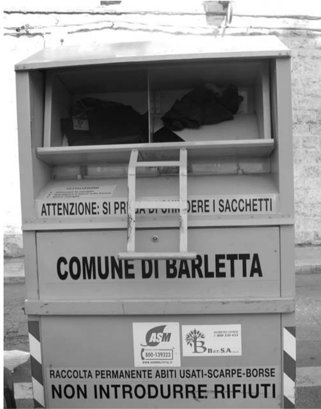
Il contenitore dei vestiti e delle scarpe utilizzate