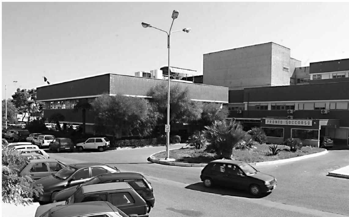
L'ospedale San Nicola pellegrino di Trani: dovrebbe essere accorpato al nosocomio di Bisceglie