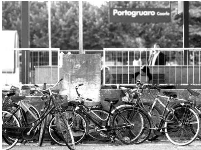
C'è chi vorrebbe varare a Trani un sistema di trasporto tramite «biciclette condivise»

«Dotiamo Trani di un sistema di bike-sharing o, per meglio dire, di biciclette condivise, così come già fatto da altri comuni del Nord Italia: è la proposta del movimento politico «Solo per Trani», che si riferisce senza dubbio a quel sistema di appositi ciclo-parcheggi in alcuni punti di snodo della città, come la stazione ferroviaria, il centro storico, le fermate degli autobus, il lungomare, zone balneari, ognuno dei quali consente il parcheggio di un certo numero di biciclette».