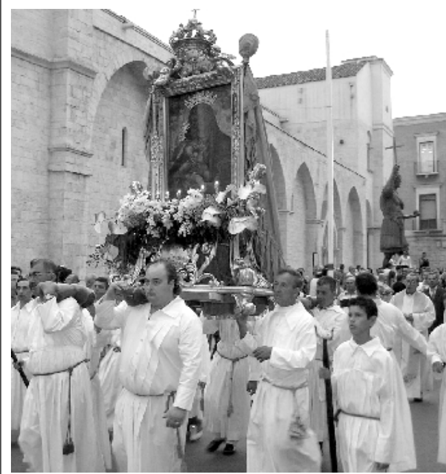
La festa patronale entra oggi nella fase più intensa

«Evviva Maria, Maria sempre evviva, evviva Maria e chi la creò» questa semplice filastroca unita a strofe dal sapore antico e ad altri canti simili, movimentata la processione dei Santi patroni che da secoli conta su un seguito di popolo devoto e attento.