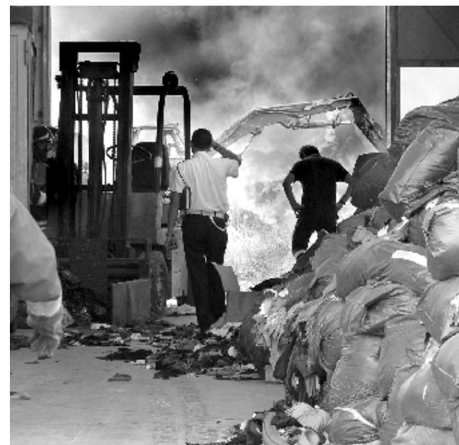
L'incendio del deposito in via Del Gelso

L'incendio, che è stato sedato completamente solo nel tardo pomeriggio grazie all'intervento di diverse squadre ed autoboti dei vigili del