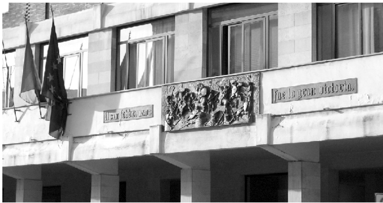
Proseguono le trattative per la nuova giunta comunale ma tarda ad arrivare il tanto atteso accordo

La trattativa per la composizione della giunta Maffei sembra la classica «partita a poker». Dopo il primo giro di carte (e relativa richiesta di altre), si è passati al rilancio. Qui, i giochi iniziano a scoprirsi ed emerge chi ha le carte forti, chi si affida al «bluff» (per