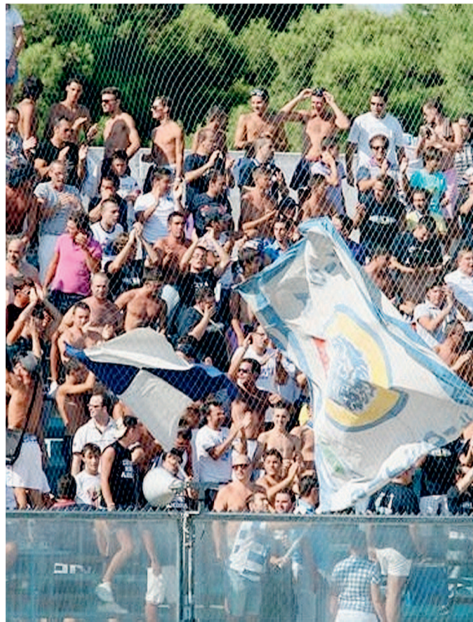
ANDRIA La curva dei tifosi azzurri al «Degli Ulivi»

LOSITO E BORRACCINO A PAG. 40 NAZIONALE E XII >>