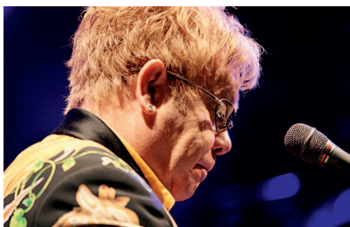
Elton John in concerto a Trani