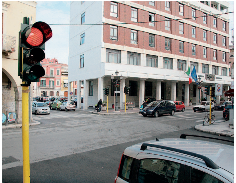
VACANZE FINITE Riprende in pieno l'attività a Palazzo di città

Il provvedimento contiene nuove disposizioni in linea alle nuove esigenze normative. E soprattutto nell'ottica dei controlli e della lotta contro gli abusi.