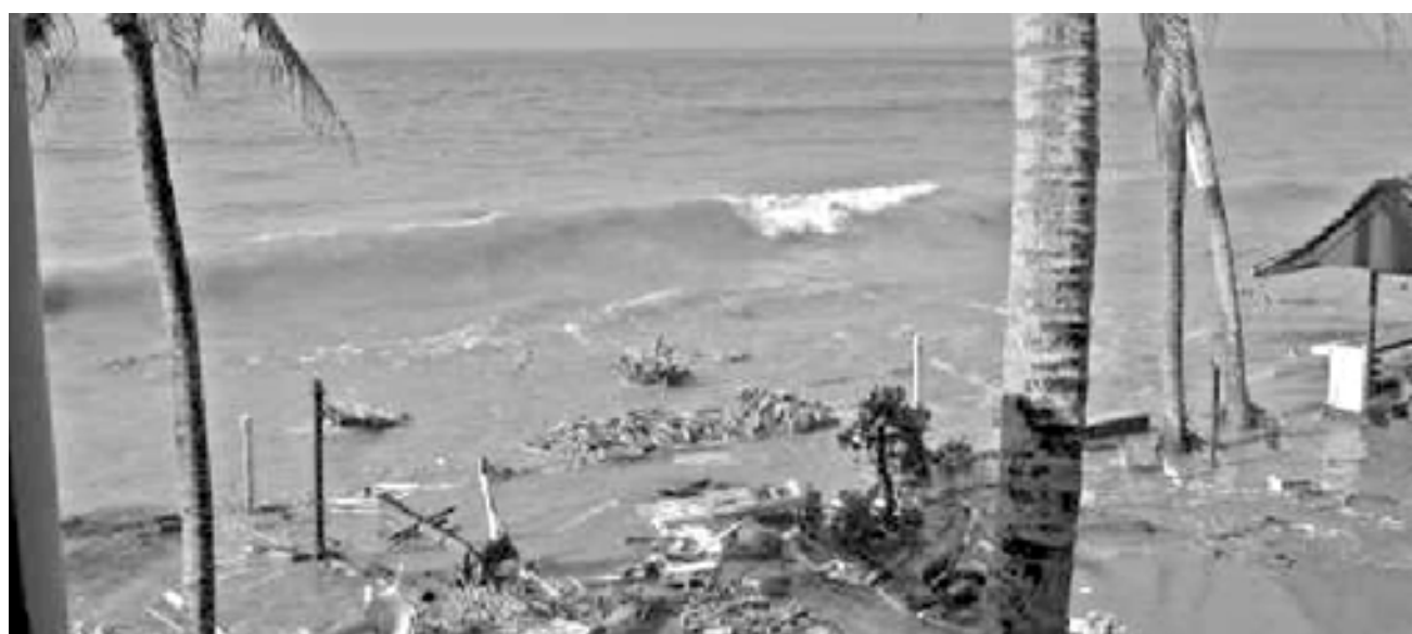
Un'immagine del disastro causato dallo tsunami del 26 dicembre 2004