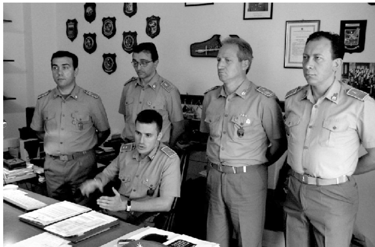
A sinistra, un momento della conferenza stampa della Guardia di Finanza nel corso della quale sono stati forniti i particolari dell'operazione che ha portato ad accertare l'evasione fiscale per più di 17 milioni di euro da parte di un imprenditore di Minervino, titolare di due imprese edili e di tre aziende tessili

Avrebbe sottratto al Fisco e agli istituti previdenziali contributi per diciassette milioni di euro